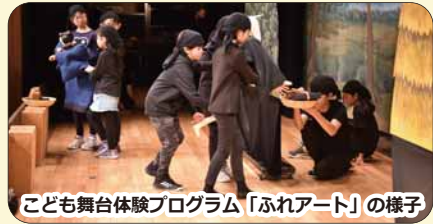
こども舞台体験プログラム「ふれアート」の様子