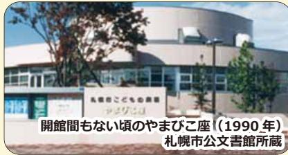
開館間もない頃のやまびこ座（1990年）

東区の昔を振り返る「東区今昔」。今月は、札幌市こどもの劇場「やまびこ座」を紹介。やまびこ座は、人形劇・児童劇・伝統芸能など児童文化を創作・学習・鑑賞・発表する場として昭和 63 年（1988 年）8 月に開館した、全国でも珍しい子どものための専門劇場です。人形劇や子ども向けの演劇の上演のほか、人材育成支援のため、初心者を対象にした人形劇講座や小学生～高校生を対象にした舞台体験プログラムなどを行っています。外観は未確認飛行物体（UFO）をモチーフにしており、休憩スペースや昔遊びコーナーがあるロビー、絵本や紙芝居の読み語りが人気の図書コーナーなど、子どもたちの豊かな感性を育む設備が充実しています。