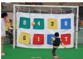
キックターゲット