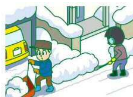
個人宅の間口除雪