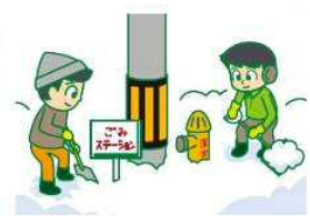
消火栓やゴミステーション 周辺の除雪