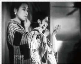
東京の女 監督：小津安二郎 1933年