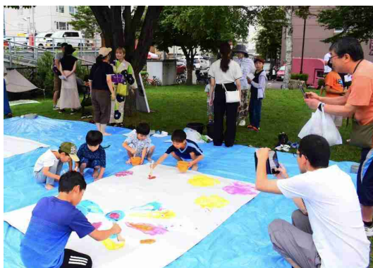
写真：公園を活用した子ども向けイベント

パブリックスペースについて、前述のワークショップでは、「活用したくても手続きのやり方がわからない」、「そもそも活用できることを知らなかった」という声が多く聞かれました。そこで札幌市では新たに「（仮称）パブリックスペース活用ガイドライン」を策定します。道路や公園、広場や公開空地等において、必要な手続きや申請フローを整理し、さらに簡素化できるものは手続きそのものを減らしていくことや、活用要件の緩和などを検討し、活用者目線に立った取組を推進していきます。