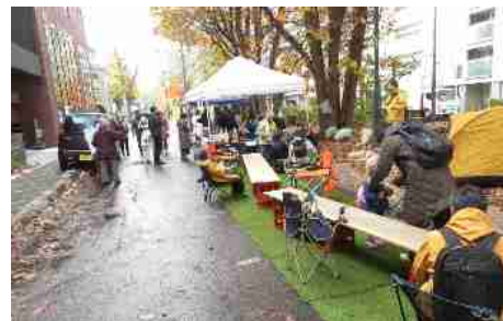
写真：ミニ大通誕生祭

さらに、地域住民自らが主体（プレイヤー）となる場合以外においても、一参加者として地域イベントに参加することや、町内会活動への参加、また移動において、自家用車ではなく公共交通機関を利用することでも「Well-Moving City SAPPORO」を推進する重要な役割を果たすものです。