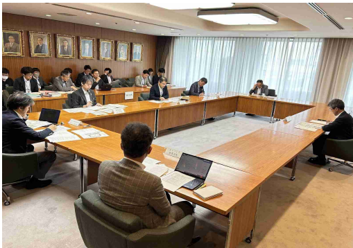
写真：札幌市ウォーカブル推進本部会議

また、行政は民間に対して積極的にデータセットを提供し、オープンデータの利 活用を促進することで、市民や企業の創意工夫を引き出す「共創の場」を支える立 場に立ちます。さらに、これまでパブリックスペース活用を牽引してきた都心部の みならず地域交流拠点においても、戦略的に施策を展開し、地域特性に応じた取組 を推進します。さらに、次項に示す「支援制度の構築・運用」を着実に進めること で、民間主体の取組を後押しする役割を担います。