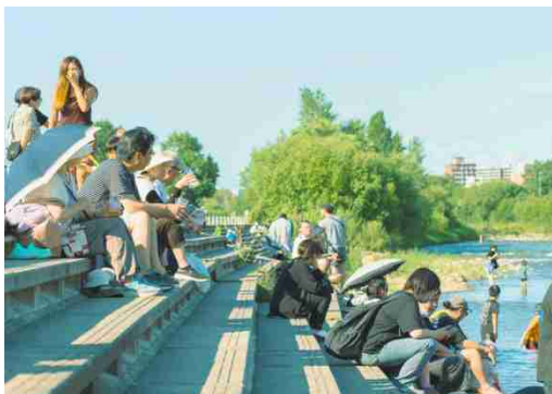
写真：川見でくつろぐ人たち

民間企業等は「Well-Moving City SAPPORO」の実現において、創造性と実行力を発揮する重要なパートナーです。民間施設等のハード整備においては、低層部におけるにぎわい用途の導入や、良質なオープンスペース整備などを推進します。また、パブリックスペースにおいて民間活力の導入により、にぎわい創出を図ることや、エリアマネジメント団体等への参画により、地域と連携した「場のマネジメント」を担うことにも期待が高まっています。豊平川の河川敷を活用して8月に2週間程度実施される「川見」イベントでは、札幌の短い夏を自然とともに楽しみ、河川に安全に触れる機会を提供することで、2025年（令和7年）実績では5万人以上の来場があり、札幌の夏の文化として定着し始めています。