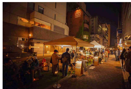
写真：公共的空間活用実証実験