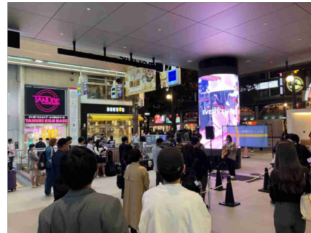
写真：公開空地（モユクサッポロ）