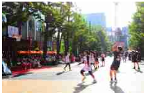
写真：北3条広場におけるバスケット（3×3）