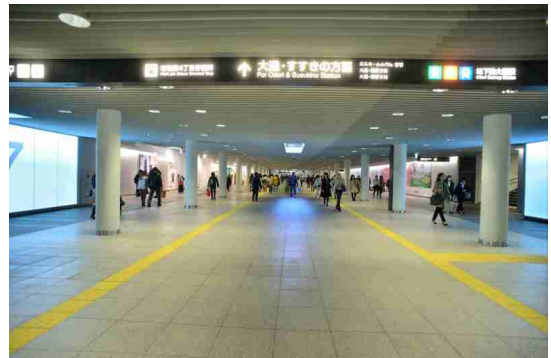
写真：地下歩行空間のハード整備