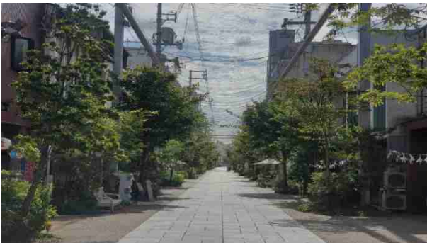
写真：福山本通商店街（広島県福山市）

「Well-Moving City SAPPORO」の実現には、パブリックスペースの整備と活用を一体的に促進する仕組みが不可欠です。これまでは道路や広場、公開空地等の整備と活用が切り分けて考えられてしまうケースや、柔軟な活用をしようとしても制度上の制約等が障壁となることも多くありました。今後は新たに、「歩行者利便増進道路（通称：ほこみち）」制度等により、地域の創意工夫を反映できる空間整備・活用を後押ししていきます。また、これまでも実施してきた、冬季のスノーキャンドル設置等の季節イベントへの支援、再開発に伴う公共貢献に対する多様なインセンティブ、緩和型の土地利用計画制度の運用による良好な民間都市開発の誘導も含め、多角的にWell-Movingな環境を整えていきます。