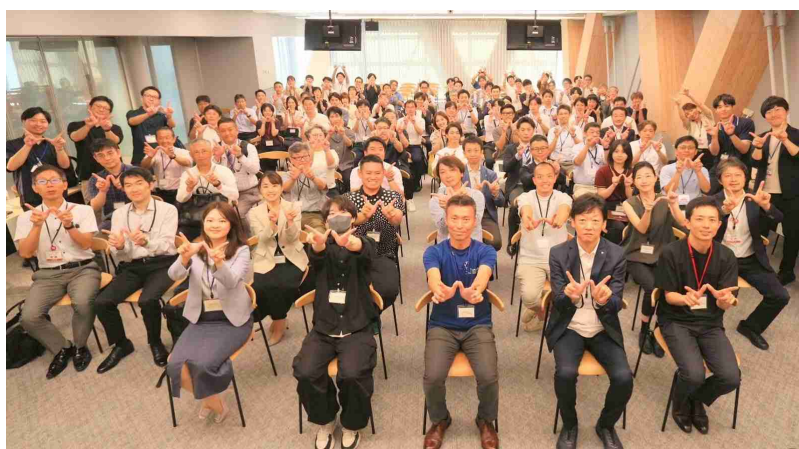
写真：サッポロウォークブルシンポジウム2025

2025年（令和7年）7月に開催した「サッポロウォークブルシンポジウム2025」では、市内各地のまちづくり団体が一堂に会するまたとない機会となり、各団体の活動内容共有や、課題解決に向けた討議が効果的であったとの声も多く聞かれており、今後も一般市民も含めて広く札幌市のまちづくりを共有する機会を設けることを検討します。