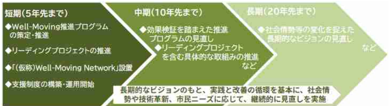
図：今後のロードマップ

本ビジョンは、令和8年（2026年）から令和27年（2045年）までの20年間を見据えた長期的な内容であり、その実現に向けては、社会情勢や技術革新の変化に柔軟に対応しながら、段階的・戦略的に推進していく必要があります。したがって、計画期間を①短期（5年先まで）、②中期（10年先まで）、③長期（20年先まで）に区分し、それぞれのフェーズに応じた取組を明確化します。