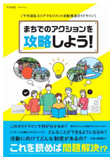
図：千代田区ガイドライン事例