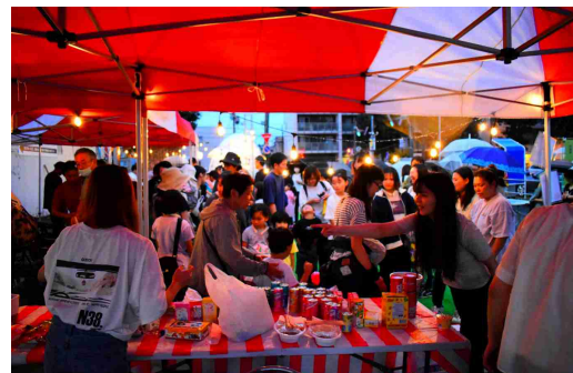
写真：平岸マルシェ