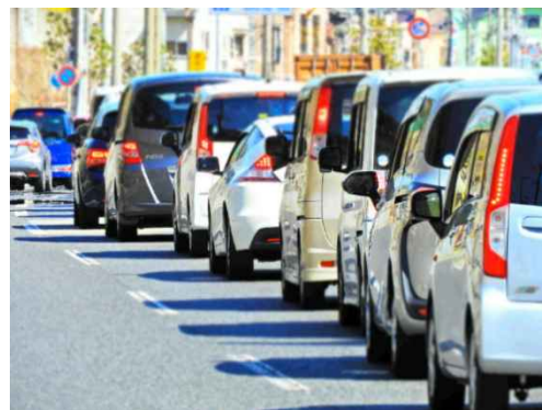
写真：交通渋滞イメージ