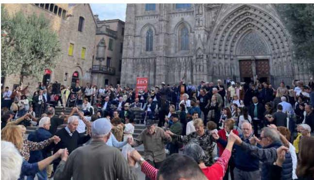
写真：休日に広場で踊る住民（バルセロナ）

次章からは、その新たな考え方と札幌の未来への意志を、札幌独自の都市空間コンセプト「Well-Moving City SAPPORO」という言葉に込めて具体的に描いていきます。市民・行政・企業・大学など、多様な主体が共に連携しながら、人々が動き、つながり、安心して暮らせるまちを実現していくための出発点とします。