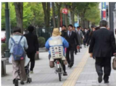
写真：歩道を走る自転車

また、札幌市では交通事故全体は減少傾向にある一方で、自転車対歩行者の事故が年々増加しています※ 12 。矢羽根型路面表示や、自転車利用者へのルール・マナー啓発を進めていますが、「歩道を走る自転車が怖い」「自転車での車道通行中に危険を感じる」という市民の声が多く聞かれるなど、歩行者を守り、さらには自転車利用者を守る通行空間の確保等が求められています。