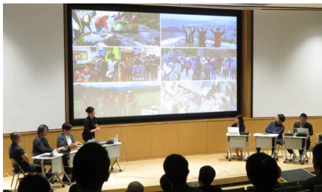
写真：有識者7名が参加したシンポジウムの様子

また、市役所外部においても、有識者7名からなる「札幌市ウォーカブルビジョン策定検討委員会」を設置し、約2年間（全5回）にわたり多角的に議論を進め、国内外の最新事例なども含めて本ビジョンの検討に生かしてきました。