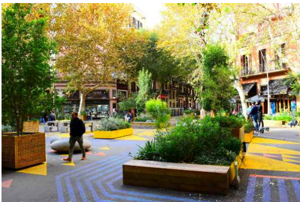
写真：再整備後の交差点空間

また、近年ではブロック単位での整備を進める以外に「Green axis（緑の軸線）」や「Green hub（緑の広場）」の整備を急速に進めています。その名前のとおり緑化が進む空間であり、路面はフルフラット構造となっています。自動車も低速（10km/h規制）で通行が可能ですが、低速で走行するため危険性が低く、まさに歩行者中心の道路空間が実現されています。