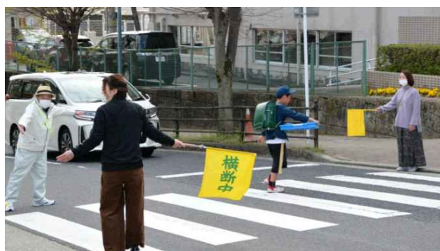
写真：通学路の安全を守るスクールガード