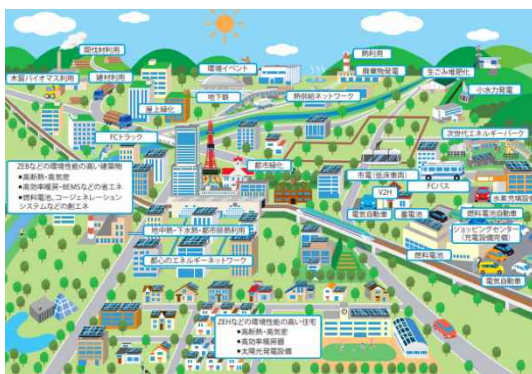
図：2050年のあるべき姿（札幌市環境局）

札幌市は「ゼロカーボンシティ」を掲げ、2050年までに温室効果ガス排出量を実質ゼロにする目標を示しています。さらに、2050年のあるべき姿として「公共交通を軸としたコンパクトな都市が形成され、歩いて暮らせるまち」や「木のぬくもりを感じながら暮らし、豊かなみどりや自然生態系が守られている」ことを明記※ 19 しております。都市空間を対象とする本ビジョンにおいても、移動の脱炭素化の観点から、前項に示す「公共交通を基軸としたまちづくりへの転換」に加え、「都市緑化の推進」や「コンパクトな都市づくり」をより一層推進することが重要です。