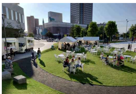
写真：アクティブガーデンの活用

また、ハード面の取組として、アメリカ ニューヨークでは、タイムズスクエア前の街路空間を恒久的に広場化（歩行者天国化）したことにより、歩行者数が11%増加し、商業施設の売上増加率が47%上昇する効果が確認されており、人中心の都市空間への転換が、交流・にぎわい効果を生むことが実証されました。