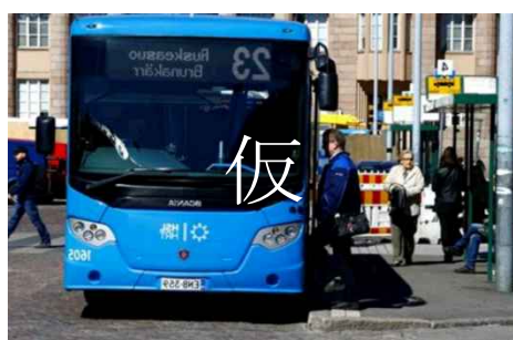
写真：市民の足となっているバス