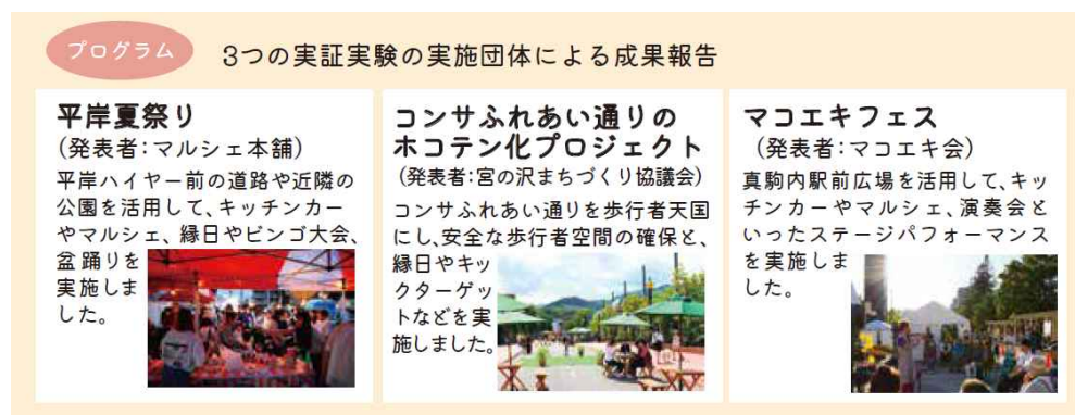
図：実施団体による成果報告会プログラム資料（抜粋）

市民公募型実証実験では、平岸、宮の沢、真駒内の3地域において実証実験を行い、終了後には実施団体によるワークショップを行い、パブリックスペースの活用に関して様々なご意見をいただきました。「公共空間活用に関する手引き（ガイドライン）があると良い」「道路使用許可・占用許可等の手続きが煩雑だったため、一括で行えるワンストップ窓口が設置されると良い」「札幌市が貸し出せる物品情報の公開や、その保管場所が確保されると良い」「各地域でまちづくりに取り組んでいる団体同士の交流の場があると、アイデアが出やすくなるのではないか」「公共空間を活用する際に、要件の緩和があると良い」といった声が聞かれました。