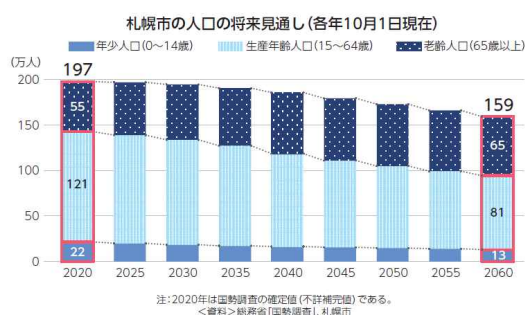
図：札幌市の人口の将来見通し

札幌市の人口は令和3年（2021年）より減少局面を迎え、令和2年（2020年）の国勢調査結果をもとに札幌市が独自に算出した将来推計人口では、令和42年（2060年）には159万人になり、令和2年（2020年）の197万人から38万人減少すると推計しています。また、これまで地域の担い手として多くの役割を果たしてきた町内会の加入率低下も進んでおり※ 14 、地域活動の担い手確保が喫緊の課題となっています。加えて、かつて地域交流の拠点であった商店街においても組合員数や商店街そのものの数も減少するなど※ 15 、まちなかの「にぎわい」が失われつつあります。まちなかの交流・にぎわいを維持・創出していくためには、都市空間の再構成やパブリックスペースの利活用によって人の流れと関係性を再生し、暮らしに根ざした交流とにぎわいを生み出すことで、地域経済を活性化させることが重要です。