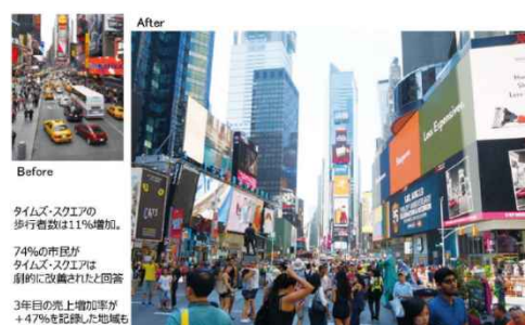
写真：タイムズスクエア前の広場化