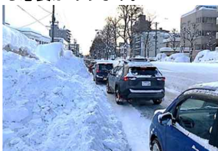
写真：堆雪により道幅が減少した道路

札幌市の交通分担率は自動車55.6%、徒歩18.8%、公共交通17.1%、二輪車8.5%※ 16 であり、自動車移動への依存度がやや高い状況と言えます。障がいや運転免許を持っていない等の理由から自動車の運転ができない方や、公共交通を主な移動手段とする観光客の方々など、誰もが円滑に移動できる公平性の確保※ 17 の観点から、公共交通を基軸としたまちづくりの一層の推進が求められます。また、冬季には積雪・凍結により徒歩や自転車での移動が難しくなることから、自家用車を運転できない人にとって移動に制限を受ける現状は、経済活動や交流機会の減少、さらには外出頻度の減少に伴う健康面の懸念など、様々な影響が想定されます。超高齢社会の到来等を踏まえると、障がいのある方や高齢者など、移動困難者に対する様々な対策も含め、誰もが円滑に移動することができるまちづくりを進める必要があります。