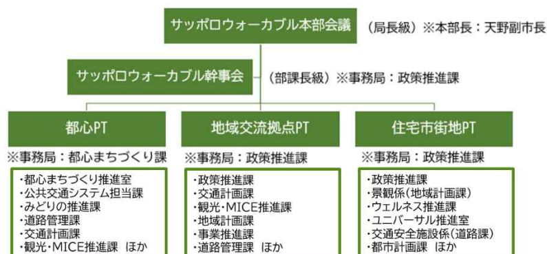
図：推進本部体制イメージ

このほかにも、官民によるビジョン検討の取組として、令和6年7月に札幌市官民連携窓口（SAPPORO CO-CREATION GATE）への提案を契機として、「一般社団法人新さっぽろエリアマネジメント」と協働で冬のウォーカブル施策に関する実証実験を実施したことや、SAPPORO DX WEEK2024において民間企業数社から成る検討チームからの政策提言をいただくなど、これまで様々な主体のみなさまと協働で検討を進めてきました。