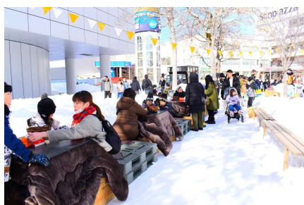
写真（中央・右）：新さっぽろ冬の社会実験における屋外活用