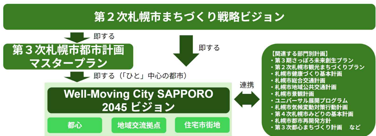
図：関連計画等体系図

このほかにも、健康政策面では「札幌市健康づくり基本計画 健康さっぽろ21（第三次）」、観光政策面では「第2次札幌市観光まちづくりプラン」など、様々な計画において「歩く」ことの重要性が多角的に位置付けられており、分野横断的に連携を深めながら施策を推進していきます。