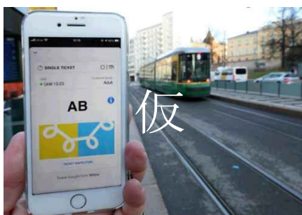
写真：Maasアプリ画面の例

フィンランド ヘルシンキでは、公共交通自体のネットワーク強化やダイヤの最適化、乗換のスムーズ化といった利便性向上策に加えて、MaaS（Mobility as a Service※ 18 ）アプリの導入により、地下鉄・バス・シェアサイクル・タクシーなど多様な移動手段を一括で検索・予約・決済でき、「誰もが適切な移動手段を選択し易くする仕組み」を構築した結果、市民の移動選択肢が拡大し、自家用車への依存度が低下しました。行政と民間が連携した先進的な取組として、持続可能な都市交通の実現に大きく貢献しています。