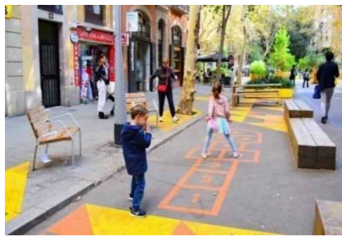
写真：再整備後の道路空間