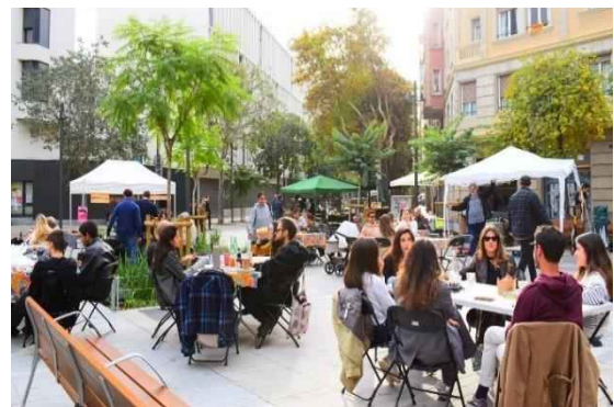
写真：車道から転換した広場（バルセロナ）