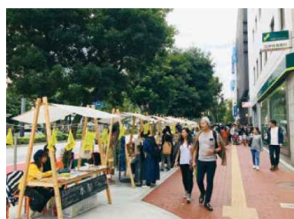
写真：グリーン大通り（東京都豊島区）

札幌市は、令和4年度（2022年度）に長期総合計画である「第2次札幌市まちづくり戦略ビジョン」を策定し、目指すべき都市像として『「ひと」「ゆき」「みどり」の織りなす輝きが、豊かな暮らしと新たな価値をつくる、持続可能な世界都市・さっぽろ』を掲げています。