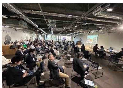
写真：SAPPORO DX WEEK2024

このほかにも、官民によるビジョン検討の取組として、令和6年7月に札幌市官民連携窓口（SAPPORO CO-CREATION GATE）への提案を契機として、「一般社団法人新さっぽろエリアマネジメント」と協働で冬のウォーカブル施策に関する実証実験を実施したことや、SAPPORO DX WEEK2024において民間企業数社から成る検討チームからの政策提言をいただくなど、これまで様々な主体のみなさまと協働で検討を進めてきました。