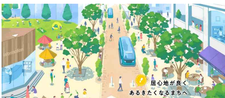
図：国土交通省ウォーカブルポータルサイト

「ウォーカブル（walkable）」とは、英語でwalk（歩く）とable（できる）を組み合わせた造語であり、直訳すると「歩ける」ですが、転じて「歩きやすい」や「歩いて楽しい」、「歩きたくなる」などの意味で使われるまちづくり用語です。