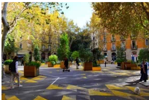
写真：再整備後の交差点空間

スペイン バルセロナでは、車中心の都市構造を見直し、生活道路を歩行者優先に再構成する「スーパーブロック」政策を推進しています。この取組では、9つの街区を一つの単位とし、その内部では車の通行を大幅に制限し、代わりに歩行者や自転車が安全に通行できる空間を確保。さらに広場やベンチ、遊び場などを設け、地域の居場所や交流の場としても機能しています。この再編により、歩行者空間が大幅に増加し※ 13 、安心して屋外で遊ぶことができる環境が実現されました。また、車の流入が減ったことで騒音や大気汚染も改善され、地域住民による活動やイベントも活発化しています。