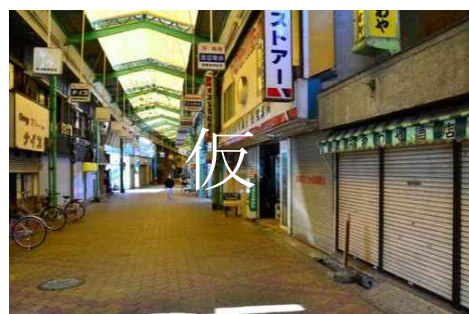
写真：空き店舗が増加する商店街