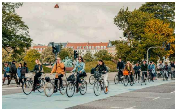
写真：自転車専用道路

デンマーク コペンハーゲンでは、都市交通と都市緑化の両面から脱炭素化を推進しています。交通分野では、電動バスや再生可能エネルギーを活用した移動手段を導入し、2022年時点の自転車道の総延長は約400km整備され、自転車通勤・通学率は45%に達し、住民一人当たりのCO2排出量は2010年と比較して約21%削減されました※ 20 。加えて、都市緑化にも力を入れ、街路樹の植栽や雨水を活用したグリーンインフラ整備により、ヒートアイランド現象の緩和や生物多様性の保全にも貢献しています。都市全体の温室効果ガス排出削減とあわせ、快適で持続可能な都市空間を実現しています。