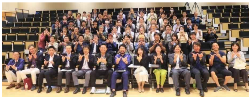
写真：サッポロウォーカーシンポジウム2024

市民ワークショップでは、「地下鉄駅などの拠点部周辺に、誰でも気軽に使える休憩・交流スペースがあるといい。」「大通公園や豊平川など、緑地や水辺空間を活用することで、より自然との共生を感じられると思う。」「普段あまり活用されていない広場等で、キッチンカーなどを常設できるとコミュニティ形成につながる。」「自転車が通行しやすい環境（現在は危険を感じる）ができ、シェアサイクルのポートももっと増えてほしい。」「全ての人にとって移動しやすいユニバーサルな街にしてほしい。」「冬や雪の良さを安心して味わうために屋内施設との連携を充実させてほしい。」「観光客にとっては自然の雪そのものが資源で歩きたくなる要素。」「ありのままの雪に触れられる場所も貴重。」などの意見をいただきました。