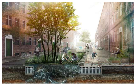
写真：グリーンインフラ整備イメージ