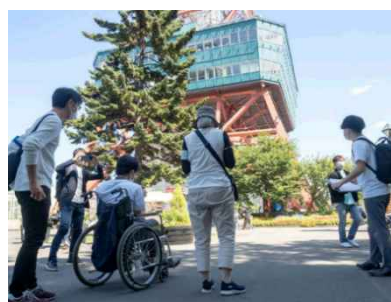
写真：車いす移動体験会