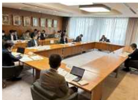
写真：推進本部会議の様子

さらに本ビジョンは、都市政策に関わる様々な部署と分野横断的に検討し、推進していく必要があることから、札幌市役所内に副市長を本部長とする「札幌市ウォーカブル推進本部会議」を設置しました。本部会議では、観光・交通・健康・景観・道路管理・都市計画など、多岐に渡る関係部門が参加し、庁内一丸となって札幌市の目指す姿や関連施策について議論を重ねてきました。