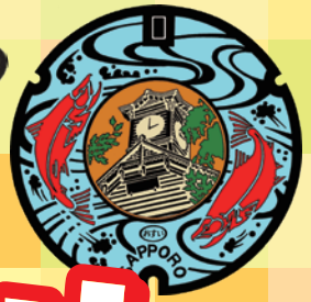
さっぽろしげすいどう 札幌市下水道 キャラクター クリンちゃん

げ すい どう てん さっぽろ 下水道展'23札幌の かいぎさい きねん 開催を記念した