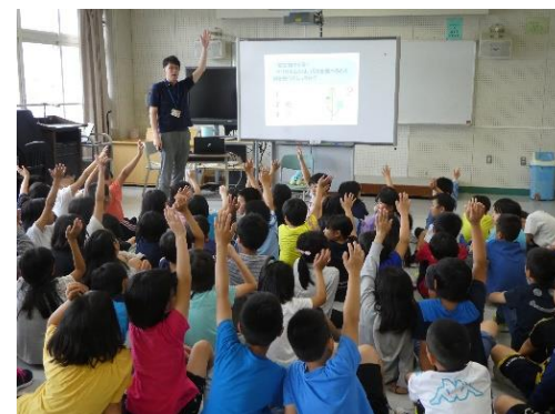
小学校への出前授業