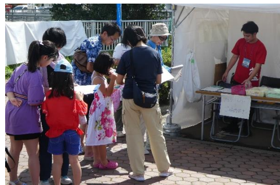
広報イベントでのアンケート調査