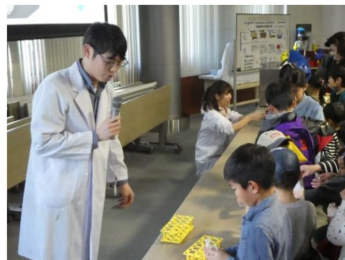
下水道科学館のイベント

○下水道事業パネル展を開催し、過去最多の2,874人が来場しました。 ○下水道の魅力を発見する写真を募集し、各区役所や写真部がある市内高校へカレンダーを配布しました。