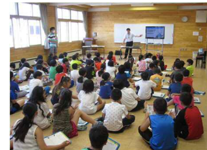
小学校への出前授業