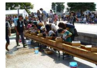
下水道科学館フェスタ②