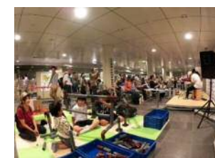
下水道事業パネル展