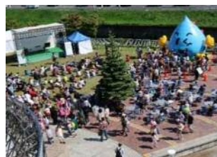
下水道科学館フェスタ①