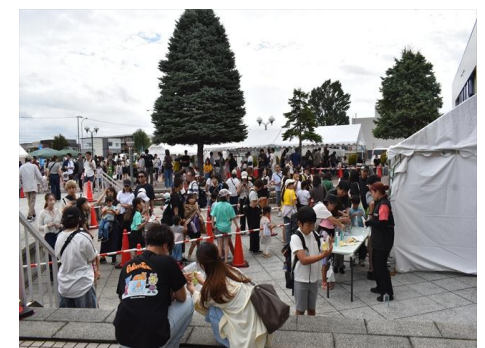
下水道科学館フェスタ