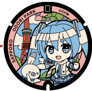
雪ミク 大通公園（中央区）