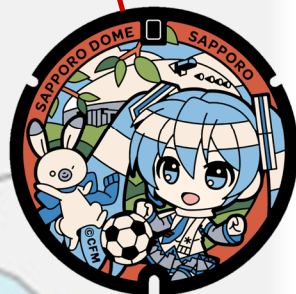
雪ミク 大和ハウスプレミストドーム（札幌ドーム）（豊平区）