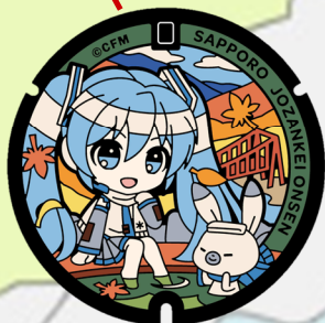
雪ミク 定山溪温泉街 月見橋（南区）

設置は令和8年（2026年）10月ころまでです。 以降は撤去し円山動物園では見られなくなる予定です。