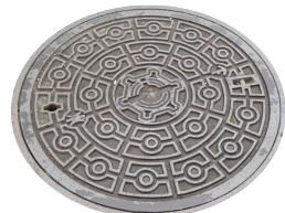
札幌市徽章 市内全域