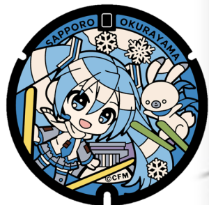
雪ミク 大倉山ジャンプ競技場（中央区）