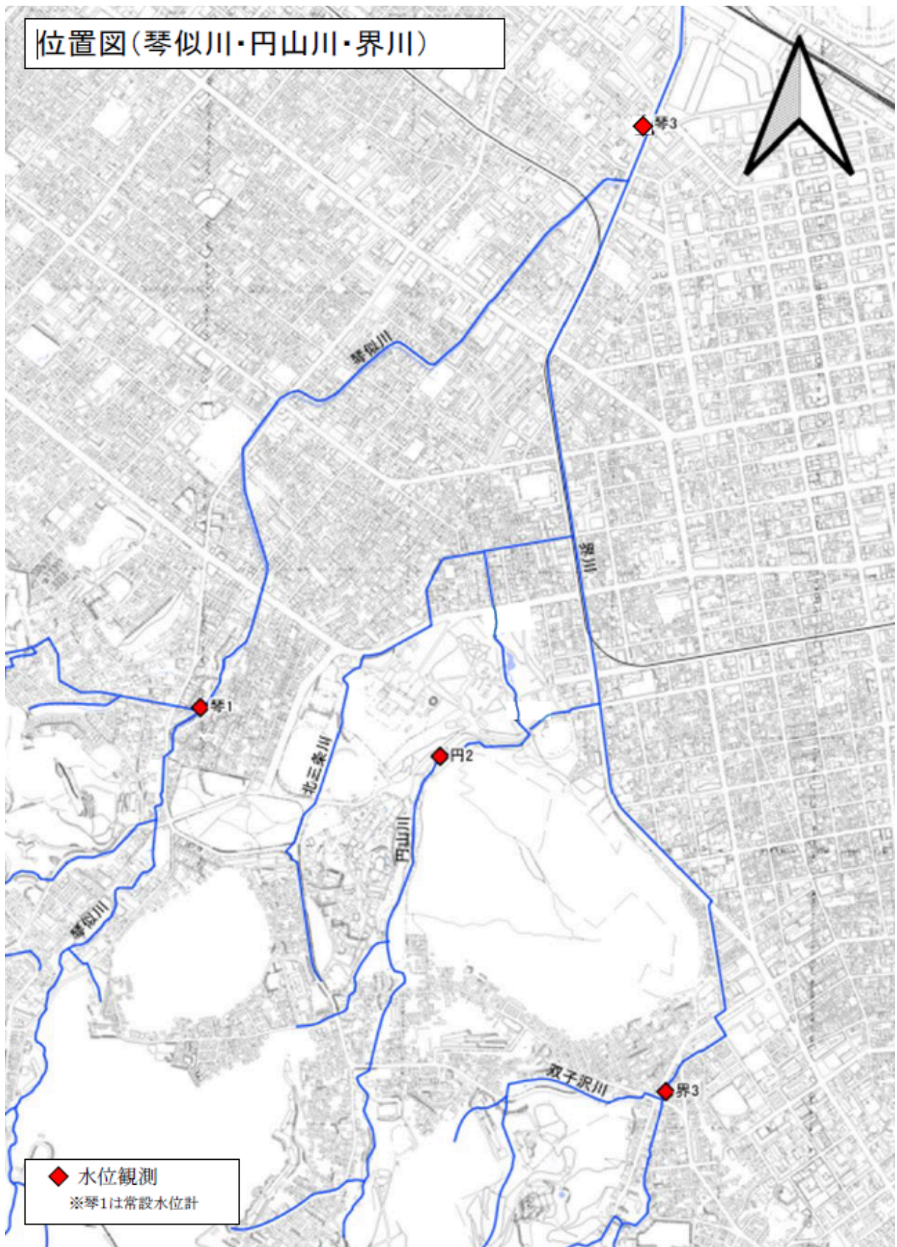
別図-1 位置図(琴似川・円山川・界川)