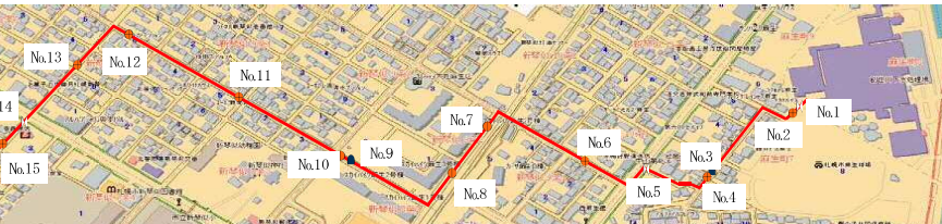
創成川処理場汚泥圧送管路マンホール一覧表