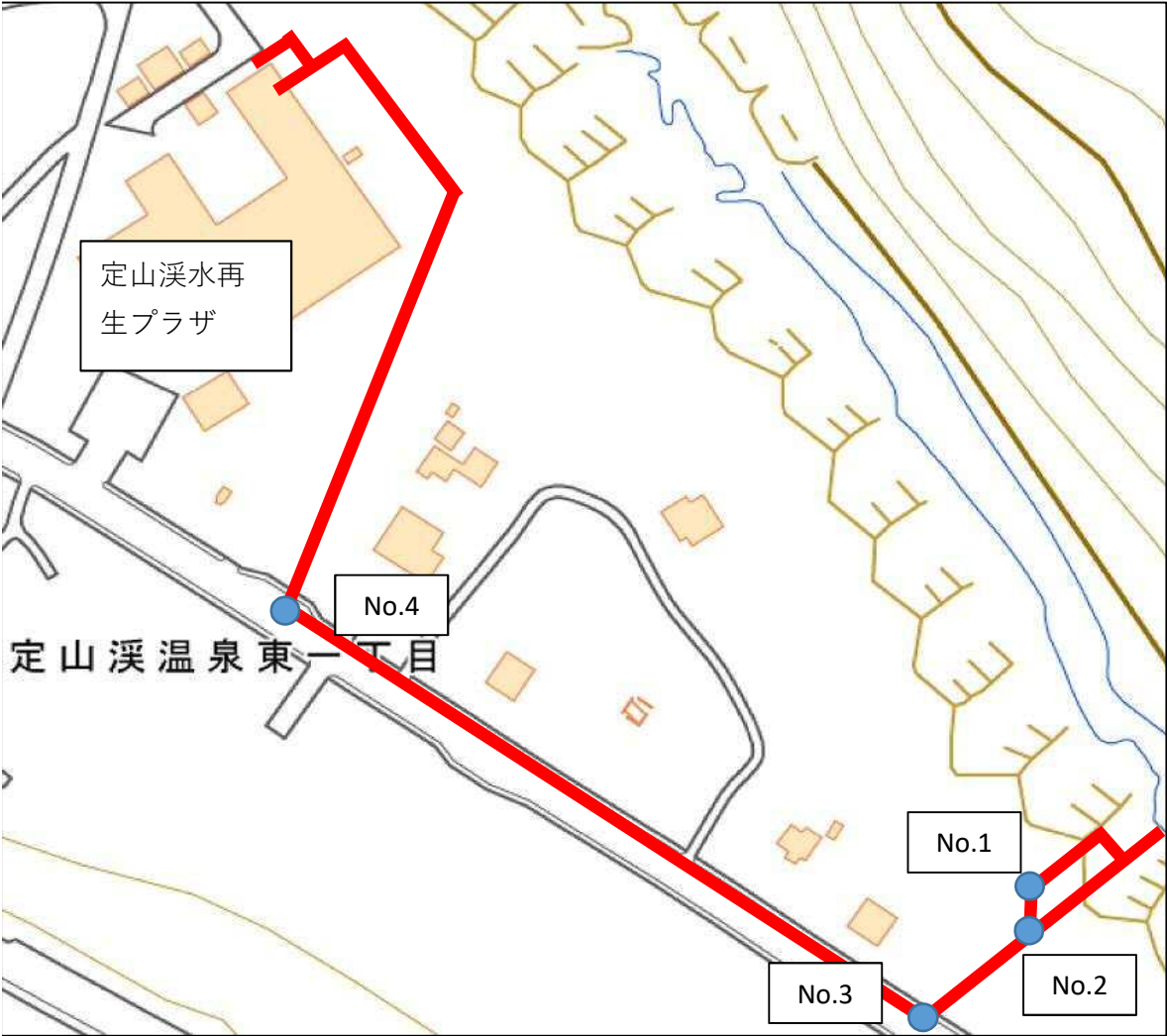
地理院地図（電子国土web）を加工して作成