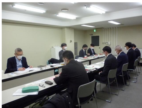
写真 グループ形式による意見聴取の様子（左：第1回/右：第2回）