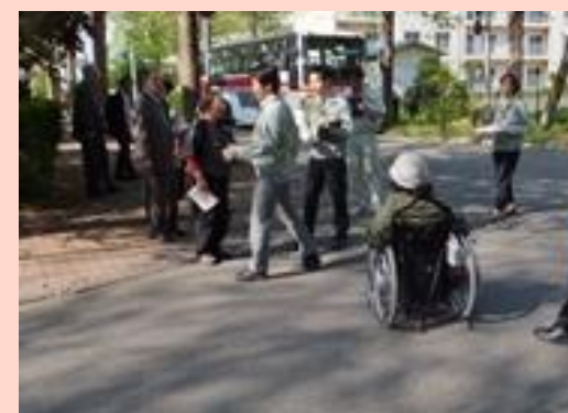
非優先道路の横断方法の検討