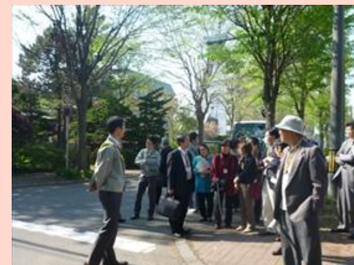
非優先道路の様子