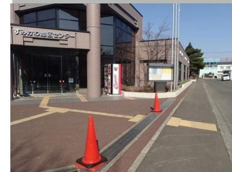
施設出入口前への点字ブロック設置イメージ