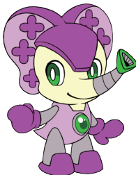
札幌市作成 たばこ対策推進 マスコットキャラクター 「スーナ」