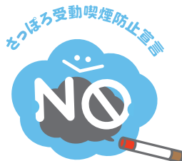
札幌市作成 ロゴマーク 「さっぽろ受動喫煙防止宣言」