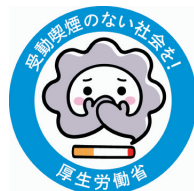
厚生労働省作成 ロゴマーク 「受動喫煙のない社会を目指して」 キャラクター名称 「けむいモン」