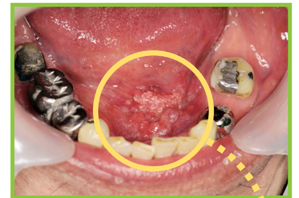
舌と歯ぐきの間にできた“がん” (口底がん)