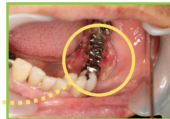
歯ぐきにできた“がん” (歯肉がん)