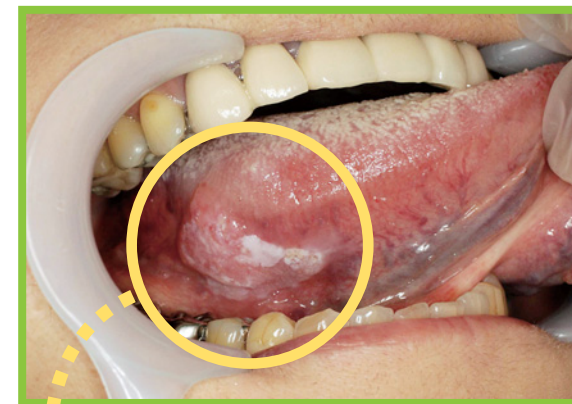
舌にできた“がん” (舌がん)

* 舌や歯ぐき、頬や上あごなど、口の中にできる“がん”を「口腔がん」といいます。