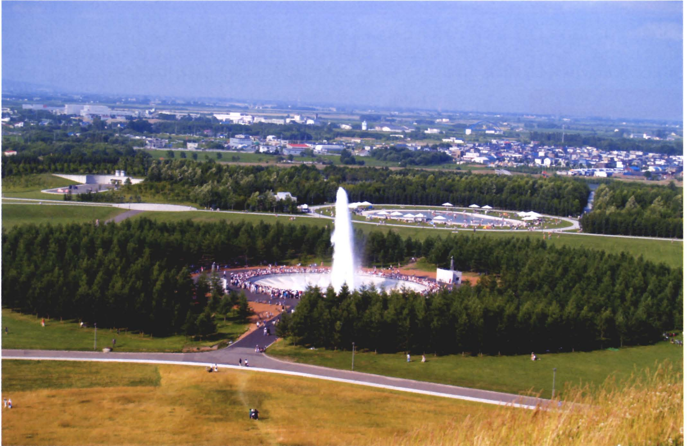
故イサム ノグチ氏がデザインした札幌市モエレ沼公園の噴水（海の噴水）