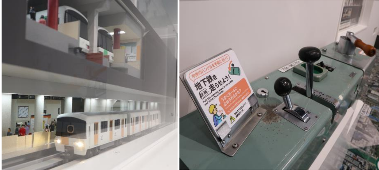
▲札幌地下鉄ライド

実際の地下鉄車両の操作盤を操作し、ジオラマ内で地下鉄車両の模型を走行させる体験型の展示