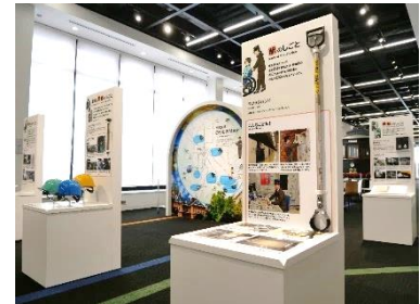
▲市営交通おしごと図鑑