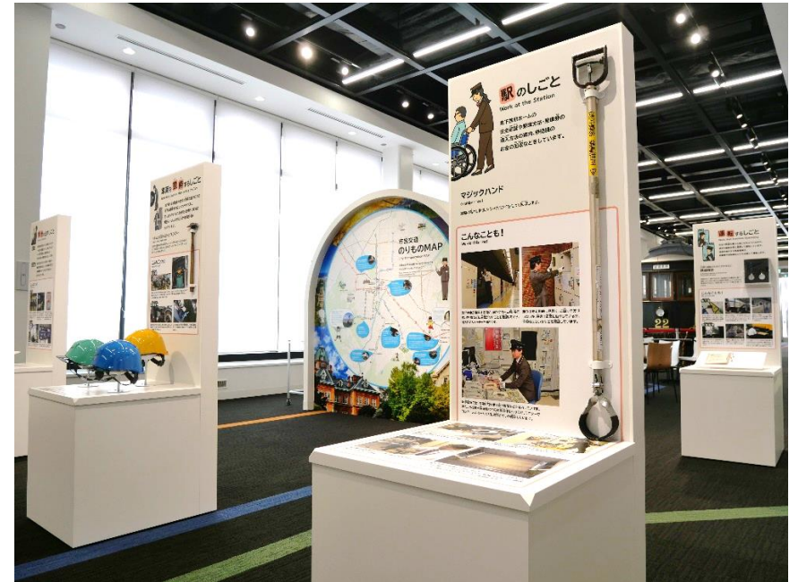
▲市営交通おしごと図鑑