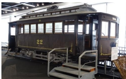
▲木製 22 号車