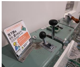
▲札幌地下鉄ライド