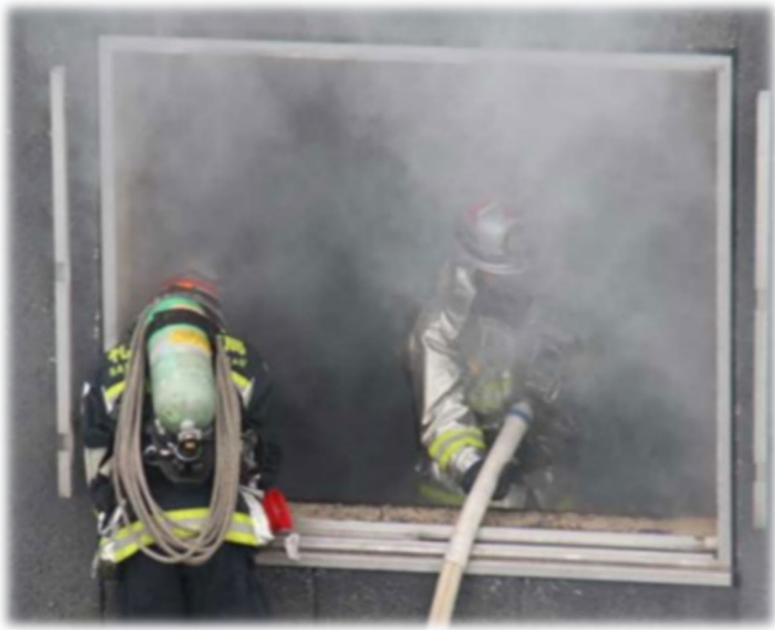
煙の噴出による視界不良