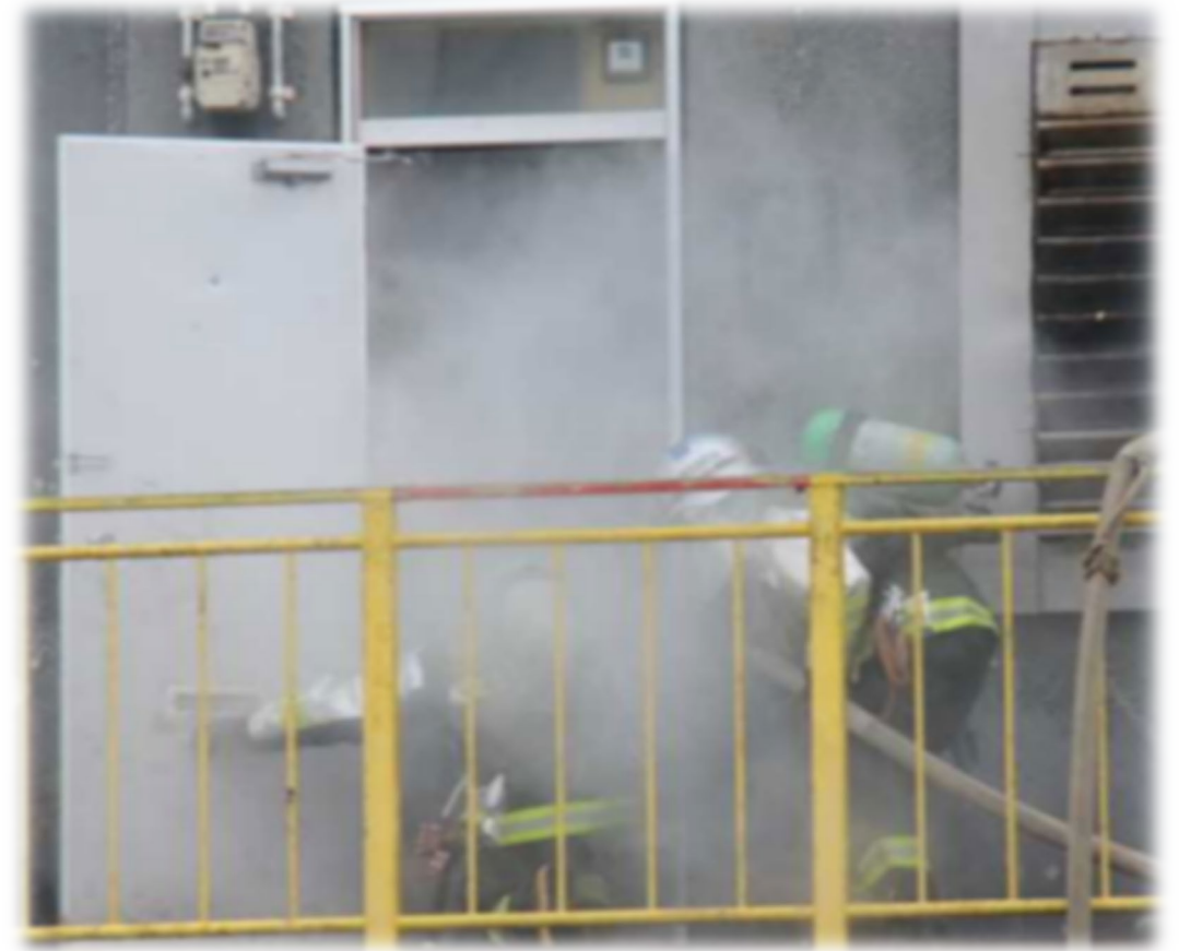
火災室内の熱の吹き返し