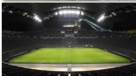
■競技会場：札幌ドーム