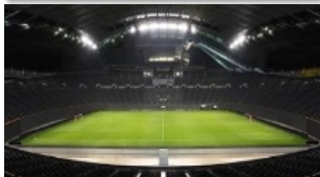
■競技会場：札幌ドーム