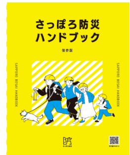
▲さっぽろ防災ハンドブック表紙

そのほか、近年の災害傾向や、寒冷地ならではの防災のポイントを示しているほか、ご自身の防災への取り組み状況を確認できるチェックシートを掲載。