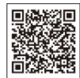
▲さっぽろ防災ハンドブック

2022 年 4 月 1 日（金）から市役所・各区役所にて順次配布するほか、市公式ホームページ（ https://www.city.sapporo.jp/kikikanri/aramasi/panf.html#bousai_handbook ）で公開。