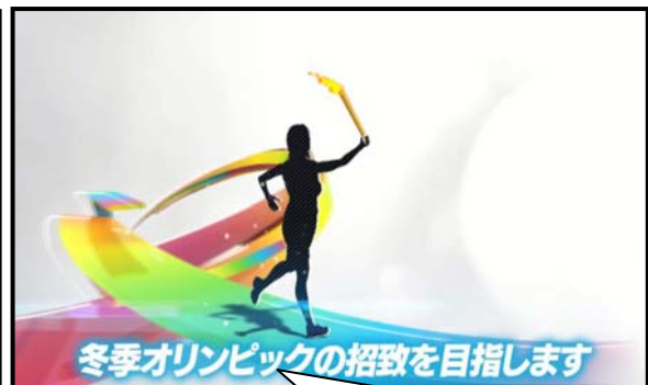
都心のエネルギーネットワーク