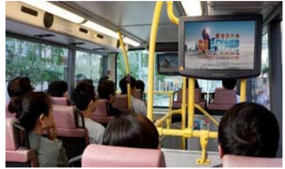
車内ディスプレイ