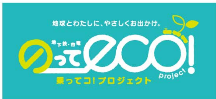
基本パターン 背景色[C70+Y30]