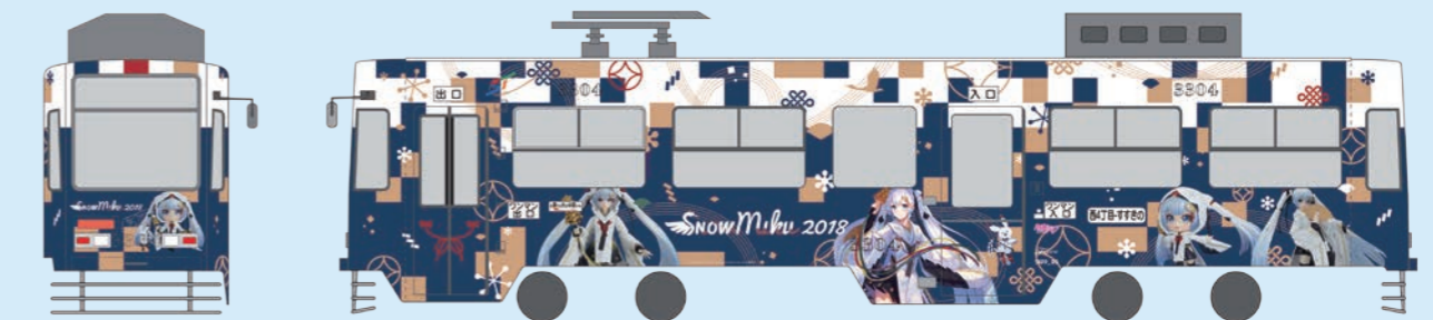
illustration by やすも 雪ミク2018 © Crypton Future Media, INC. www.piapro.net piapro