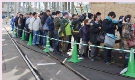
illustration by 豆の素/雪ミク2016 © Crypton Future Media, INC. www.piapro.net piapro 協力: 札幌市中央区・札幌市交通局・市電の会

初音ミクは、今や世界的なバーチャル・シンガーキャラクターとなり、雪ミク電車も今回で6回目、11月22日(日)から平成28年3月27日(日)まで運行されました。2016年は「北海道の冬を楽しむウィンタースポーツをテーマにデザインされた雪ミクがラッピングされて、冬の北海道を彩りました。また運行前日の11月21日(土)に行われた内覧会(車両展示)には、電車事業所に約600名の来場者が集まりました。今回、初登場となる雪ミクの着ぐるみと記念撮影をするなど大いに楽しんでいただき、車両や雪ミクグッズの展示等で雪ミクワールドを堪能しました。