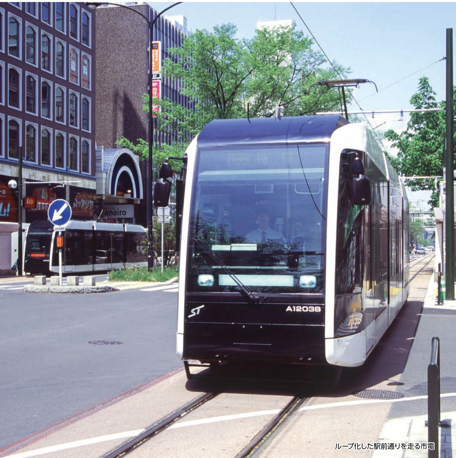
ループ化した駅前通りを走る市電