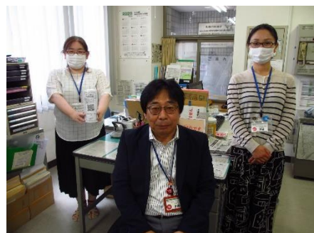
【まちづくりセンタースタッフ】