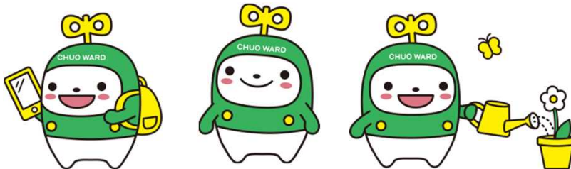
中央区マスコットキャラクター「中ウォークン」