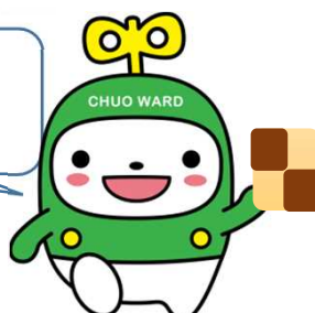
中央区マスコットキャラクター 「中ウォークン」