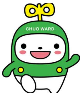
中央区マスコット キャラクター 「中ウォークン」

『「中ウォークン」は、中央区のマスコットキャラクターです。弊社は、中央区の許可を受け、「中ウォークン」のデザイン及び名称を使用しています。許可者の中央区は、製造者ではなく、本製品に何らかの責任を負い、又は本製品を推奨するものではありません。』