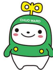
中央区キャラクター 中ウォークン