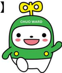
中央区マスコットキャラクター「中ウォークン」