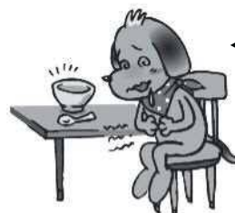
いろいろな不安による心身の不調

・学校に行くのが辛い ・いじめられている ・暴言や暴力が怖い ・コロナ感染が怖い ・悲しい、寂しい