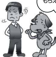
家族や先生との関係

・学校に行くのが辛い ・いじめられている ・暴言や暴力が怖い ・コロナ感染が怖い ・悲しい、寂しい