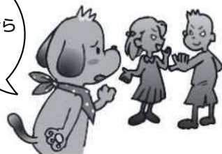
学校生活・友人関係