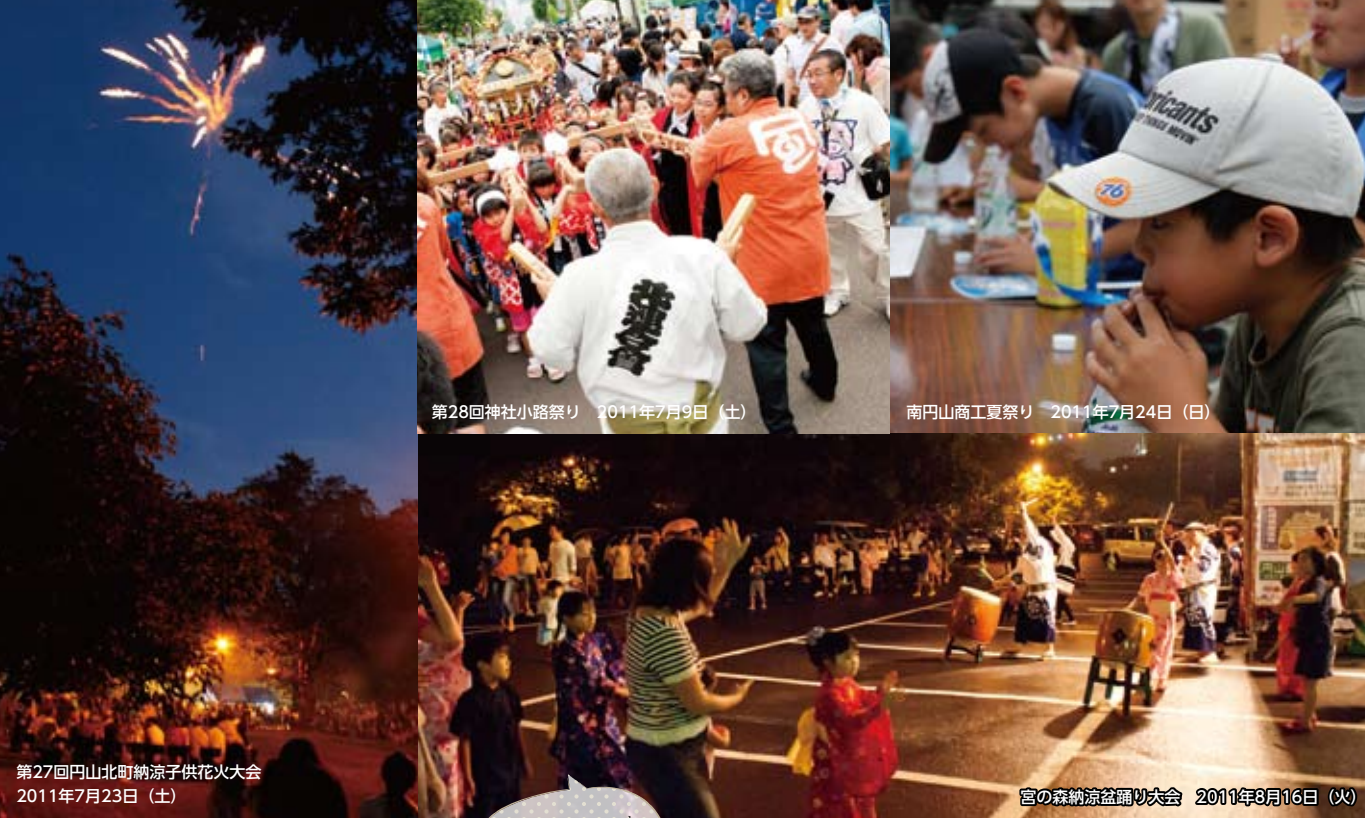
第28回神社小路祭り 2011年7月9日(土)