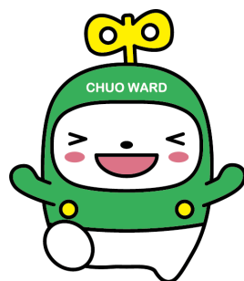
中央区マスコットキャラクター 中ウオーくん