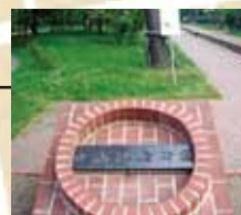
なえぼさくら公園