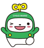
中央区マスコットキャラクター 「中ウオーくん」

介護予防教室の実施、地域の介護予防活動の支援や 介護予防などの相談窓口としての役割も担っています。 気軽にお問い合わせください。