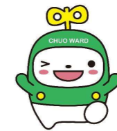
中央区マスコットキャラクター「中ウォークン」