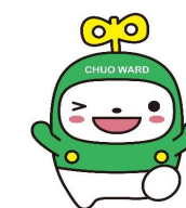
中央区マスコットキャラクター「中ウオーくん」