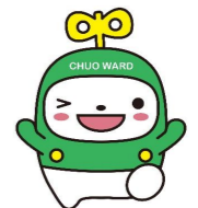
中央区マスコットキャラクター 「中ウォークン」