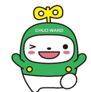
中央区マスコットキャラクター「中ウオーくん」