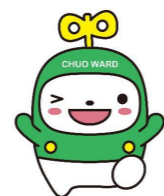
中央区マスコットキャラクター 「中ウオーくん」