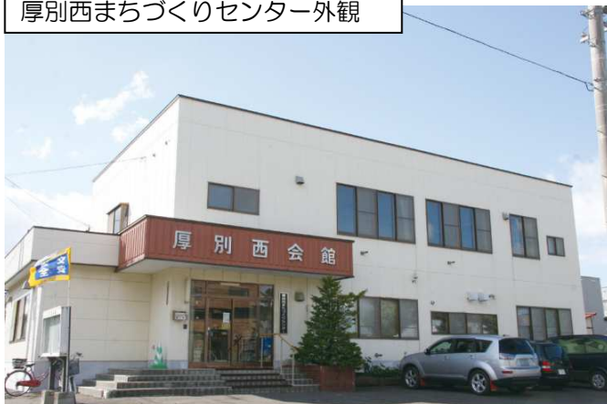
厚別西まちづくりセンター外観