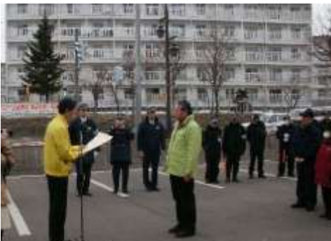
荒井厚別区長から笠井自治連合会会長に表彰状が手渡されました。

もみじ台地区では平成21年7月から交通死亡事故が発生しておらず、平成24年3月29日で交通死亡事故ゼロ1000日を達成しました。