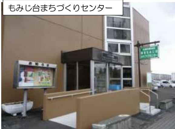
もみじ台管理センター1階にあります。