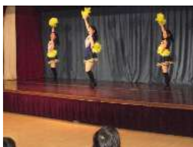
元気いっぱいのチアダンス

午後の4時間目は北星学園大学チアダンス部スターリーズによる、元気いっぱいのダンスが披露された後、地域の子どもたちも舞台上上がり、チアダンスの基本を一緒に体験しました。