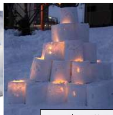
スノーキャンドル

詳細：新さっぽろ冬まつり実行委員会事務局(厚別区役所地域振興課内) 電話 895-2442