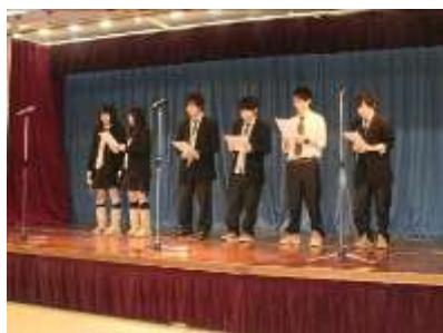
聖歌隊の美しい歌声

地域の方々が大ホールでいろいろな催しを楽しんでいる間に、ロビーでは餅つきが行われ、つきたてのお餅でお汁粉が振舞われました。