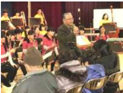
もみじ台自治連合会東会長挨拶

今回で4回目となる「もみじ台の地域の大広間」が、2月24日（日）にもみじ台管理センターで開催されました。今回は、「地域のがっこうを楽しもう」をテーマに、1時間目から6時間目までの演奏や講座を、地域の多くの方が楽しみました。