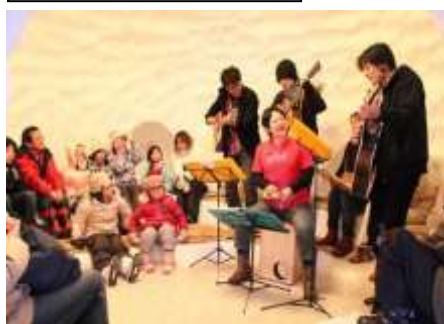
うたごえかまくら