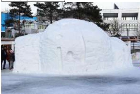
おやすみ雪だるま