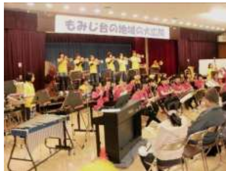
もみじ台中学校吹奏学部の演奏

1時間目 のもみじ台中学校吹奏学部の演奏は、オープニングの「威风堂々」からアンコール曲まで9曲演奏され、「上を向いて歩こう」では演奏に合わせて地域の方が歌う場面もありました。