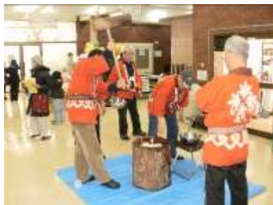
ロビーでの餅つき