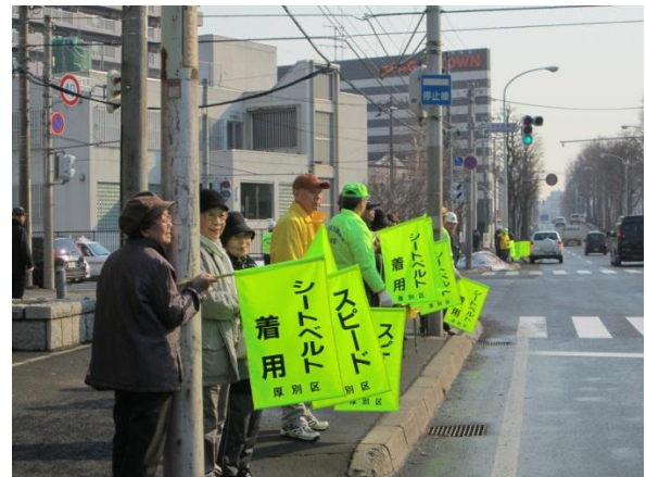
【南郷通り大谷地東2丁目付近】