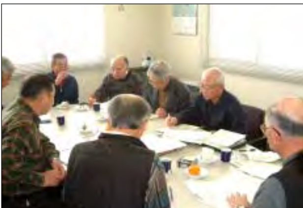
「地域活動を伝えるために協議するスタッフ」