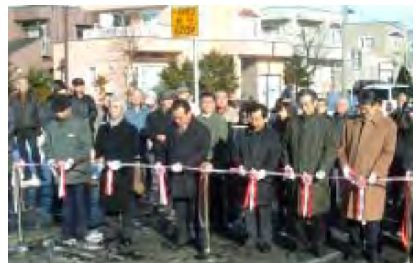
「森林公園橋渡り初めでのテープカット」