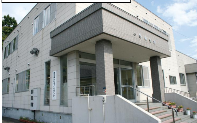
厚別東まちづくりセンター外観