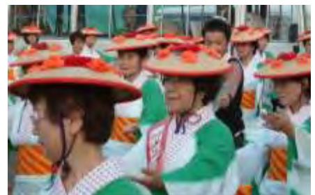
昨年の区民まつり(厚別音頭)