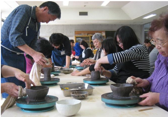
江別セラミックアートセンターの工房で行われました

11月7日（金曜日）と27日（木曜日）の2日間にわたり、厚別東地区各種団体交流会・まちづくり会議の主催で、陶芸体験学習会が開催されました。2日間で延べ60名の皆さんが参加して、作品作りに取り組みました。