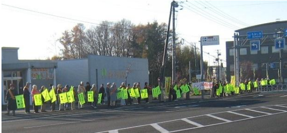
小野幌橋付近での一斉街頭啓発（11月11日）

11月11日（火曜日）から20日（木曜日）まで、冬の交通安全市民総ぐるみ運動が行われました。厚別東地区においては、死亡交通事故ゼロの記録を更新中です。11日は、約80名の皆さんが国道12号線の小野幌橋付近で街頭啓発を行い、ドライバーや歩行者に交通安全を呼び掛けました。