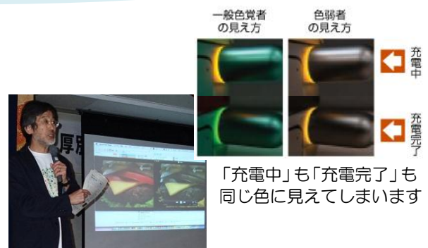
講師 北海道カラーユニバーサルデザイン機構 栗田副理事長