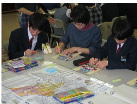
付箋に思ったことを書き込んでいきます

平成27年3月11日(水曜日)、小野幌会館において第3回目となるまちづくり会議を開催します。会議では、平成27年度の重点テーマや実施事業の取組みなどについて審議を予定しています。