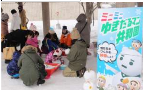
ゆきだるマン作りも人気