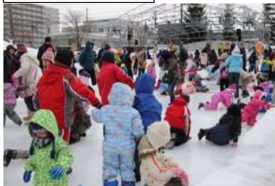
にぎわうアイスリンク