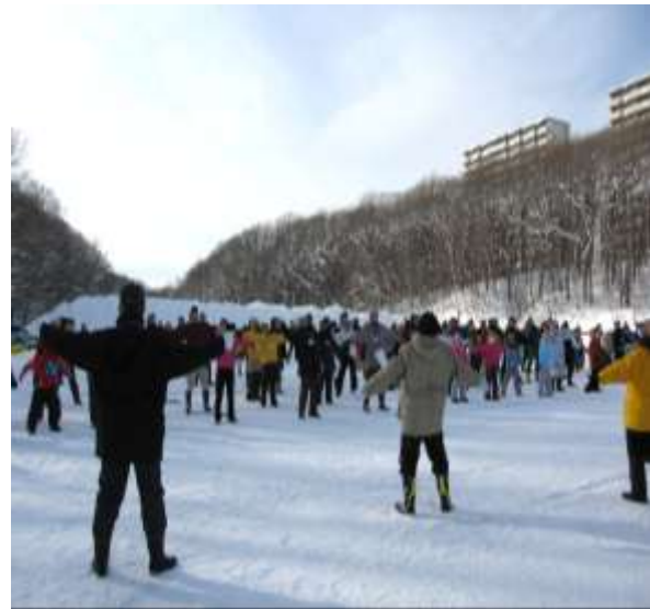
ラジオ体操（準備運動）