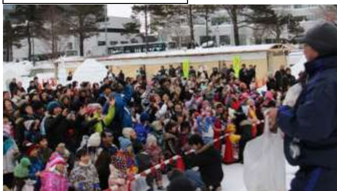
恒例のおもち&おかしまき