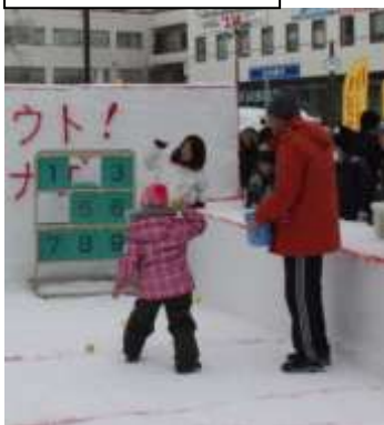
ストラックアウト